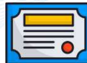
ISO 14001:2015 - Sistema de Gestión Ambiental