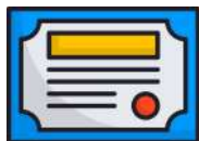
IATF 16949:2016 - Sistema de Gestión de Calidad

Además, la certificación externa respalda nuestro compromiso con la mejora continua y fortalece la confianza con nuestros clientes y partes interesadas. A lo largo de los años, obtuvimos las siguientes certificaciones: