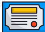
ISO 50001:2018 - Sistema de Gestión de la Energía